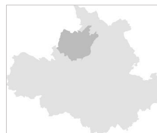
Flughafen/ Industriegebiet Klotzsche